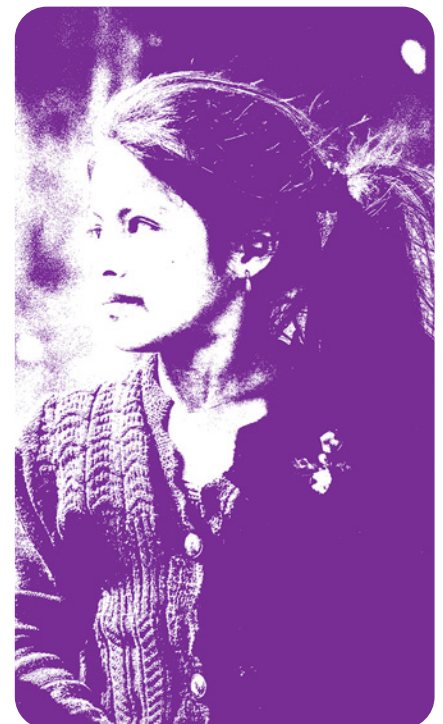
Fotografía: Edimetry B. Unsplash, Guatemala.

El gran reto es que los gobiernos comprendan la importancia de contar con esta información diferenciada y que para ello es más fácil