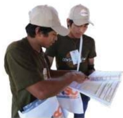
Fuente: INE. Resultados Preliminares del IV Censo Nacional de Población y Viviendas para Pueblos Indígenas 2022.

Según los resultados preliminares el pueblo de mayor población es el Mbyá Guaraní con 27.835 personas y de menor población el pueblo Tomaráho con 213 personas.