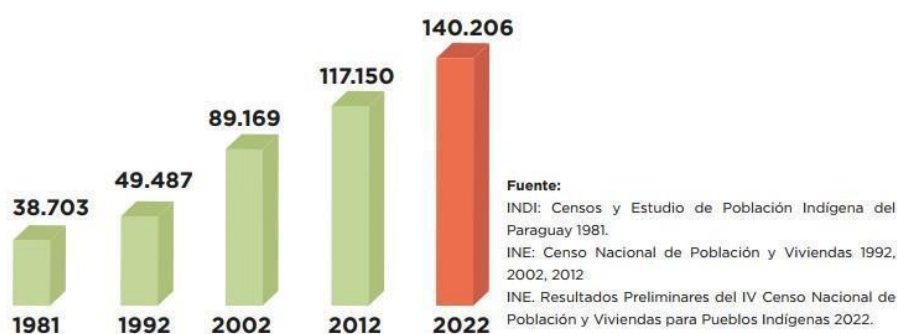
Imagen 3: Crecimiento poblacional en Paraguay