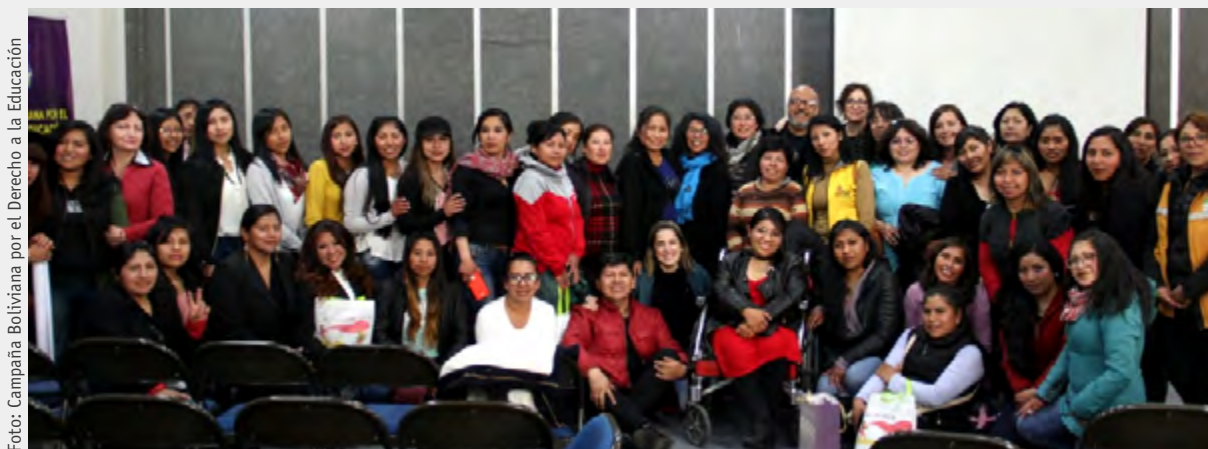
Participantes del Foro Internacional “Compartiendo experiencias y buenas prácticas en la educación de la primera infancia con enfoque de género”.