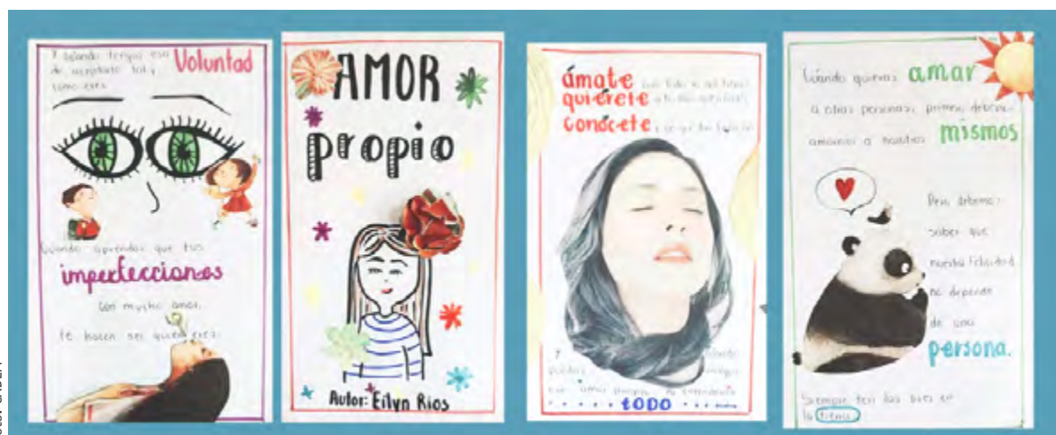
Expresiones de estudiantes de México recogidas en el contexto de pandemia

La red Espacio Sin Fronteras (ESF) publicó una nota en la que expresa solidaridad con todas las personas afectadas por el virus. También hace un llamado a la comunidad internacional por la creación de medidas de protección y atención humanitaria para las personas migrantes y refugiadas que se encuentran en situación de mayor vulnerabilidad. Eso, especialmente, porque suelen encontrarse en contextos de calle, alojamientos hacinados y trabajos informales, sin cobertura de asistencia, ni protección social.