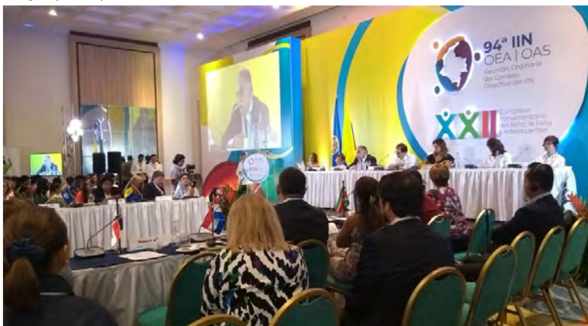
XXII Congreso Panamericano del Niño, la Niña y Adolescentes, Cartagena (Colombia), octubre de 2019.

Por fin, se señala como un logro del período el inicio de alianzas y el pedido de membresía de la CLADE a la red internacional Child Rights Connect, la cual tiene actuación en Ginebra y se enfoca en defender los derechos de la niñez a través de la incidencia y participación de la sociedad civil ante el Sistema ONU. A partir de esta articulación estratégica, se espera que la Red CLADE pueda obtener información, orientaciones y puentes de contacto para incidir con más eficacia ante espacios como el Comité sobre los Derechos del Niño y el Consejo de Derechos Humanos de la ONU.