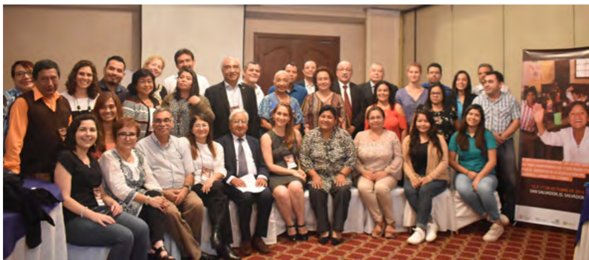
Foto del 3º Encuentro Regional de la Red Mixta de Parlamentarios/os y Sociedad Civil por el Derecho a la Educación en América Latina y el Caribe (El Salvador, octubre de 2019).

participación sustantiva y efectiva de docentes, estudiantes, referentes familiares y de la sociedad civil en general en el diseño, monitoreo y evaluación de políticas y legislaciones educativas; y espacios educativos libres de violencia, no militarizados, así como capaces de contrarrestar la creciente criminalización de estudiantes y docentes en nuestra región.