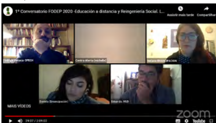
Imagen de diálogo virtual realizado por el Foro por el Derecho a la Educación Pública de Chile, para discutir el contexto educativo nacional ante la pandemia COVID-19.

En Colombia, se publicó en marzo de 2020, en el marco de la pandemia, una directiva del Ministerio de Educación que suspendía la contratación de la prestación del servicio educativo para personas adultas y suspendía también el ingreso de personas jóvenes