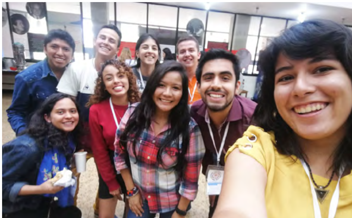
Integrantes del MELAC