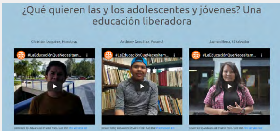
Imagen de la página web especial con demandas de jóvenes y adolescentes de la región, creada por la CLADE en el marco de la campaña “La Educación que Necesitamos para el Mundo que Queremos”.

>> Conoce otras acciones que los miembros de la CLADE llevaron a cabo, presionando por la garantía del derecho a la educación y participación de las juventudes.