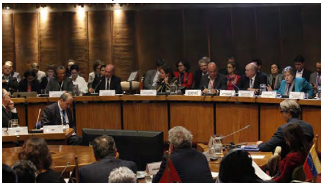
Foto del Foro de Países de América Latina y el Caribe sobre Desarrollo Sostenible

A partir de esto, en la segunda reunión se presentó el documento de posicionamiento del GT sobre Educación Sexual Integral y se conformó una comisión de trabajo sobre el tema de acceso a la información, brechas digitales y protección en el uso de datos que deberá presentar el documento borrador en la primera reunión del año 2021.